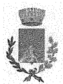
COMUNE DI ANDEZENO