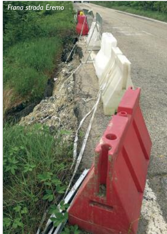
Frana strada Eremo

Credo sia stato importante avere dato alcune fondamentali informazioni e fatto un po' di chiarezza su tematiche che comportano illazioni e critiche che si ritiene del tutto infondate ed immeritate. L'Amministrazione comunale si è sempre attivata e continuerà a farlo sollecitando i competenti Enti ad intervenire e ad assumersi le proprie responsabilità e formulando proposte costruttive per portare a soluzione i problemi, tuttavia non è possibile operare direttamente considerando che non possiamo agire su ciò che non ci appartiene (pur avendolo richiesto con sottoscrizione di formale convenzione utilizzando i proventi delle sanzioni a loro spettanti).