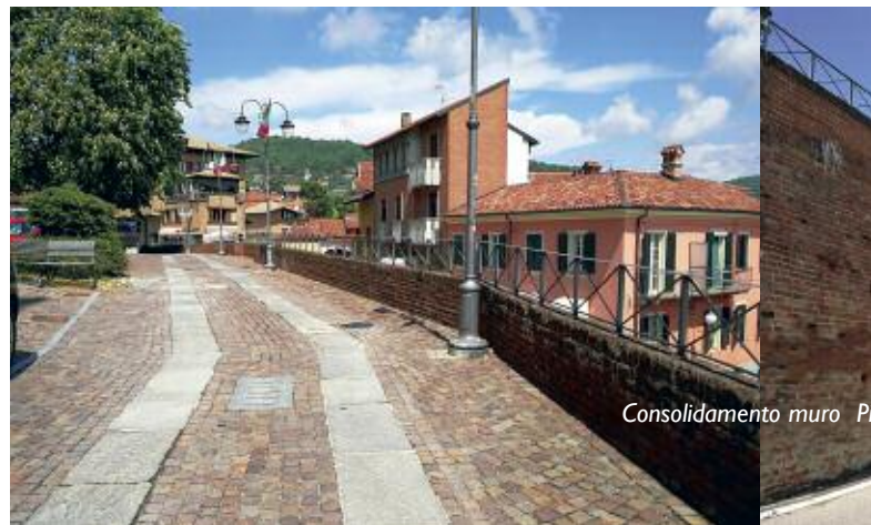
Consolidamento muro P