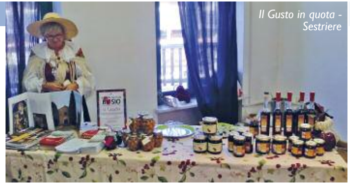
Il Gusto in quota - Sestriere

Innanzitutto abbiamo lavorato per la conservazione e restituzione alla fruizione pubblica dei principali immobili storici di Pecetto, in particolare la Chiesa di San Sebastiano, la Chiesa dei Batù, la Villa Comunale, il Tiro a segno, la Biblioteca, la riqualificazione di Piazza Roma e di via Umberto, il cuore del nostro paese. La ristrutturazione è stata accompagnata dalla produzione di materiale iconografico e promozionale in più lingue che è stato distribuito in molteplici occasioni pubbliche. A seguito di tale attività il nostro paese è stato incluso in rassegne culturali ed eventi che hanno portato visitatori italiani e stranieri nel nostro territorio. Accanto alle opere di conservazione abbiamo lavorato per inserire Pecetto nei percorsi turistici sovracomunali, aderendo a Turismo Torino, al progetto Strade di Colori e Saperi, attraverso cui abbiamo finanziato iniziative quali Cinema in cascina e Fiabe e frutta che hanno consentito di far conoscere le nostre aziende agricole come luoghi di produzione e svago. Recentemente abbiamo aderito ai principali