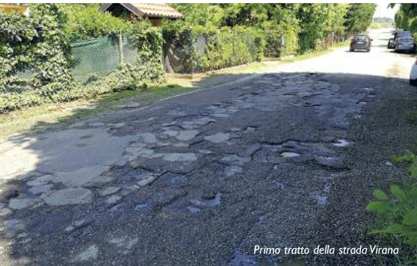
Primo tratto della strada Virana

Nel 2017 ritornammo alla carica con gli uffici Metropolitani con nuove istanze che permettessero di realizzare le opere segnalate aggiungendo anche una proposta di tipo economico. Come è noto le sanzioni rilevate su strade non di proprietà, spetta per il 50% (al netto delle spese) all'Ente proprietario, questo in base alla Legge 120/2010. La stessa Legge prevede che vengano attuate eventuali convenzioni per utilizzare i proventi nel territorio. Abbiamo così proposto