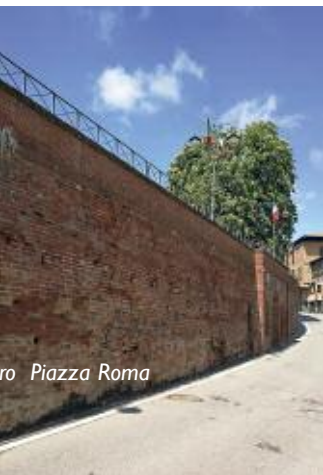
ro Piazza Roma

Il Comune ha partecipato ad un bando sui percorsi ciclabili di collegamento con il progettato percorso "Dal Monviso al Santuario di Crea" vedendo trascurate le sue proposte dai Comuni capofila, con la magra consolazione di vedere solamente nominati i punti di interesse lungo percorsi proposti. In ogni caso le proposte elaborate potranno essere ripresentate in futuro. Altri bandi su nuove piste ciclabili urbane, o percorsi ciclabili di ampliamento di reti esistenti ci hanno visto impossibilitati a parteciparvi per mancanza di requisiti. Poiché questo è un campo in cui, nonostante le difficoltà incontrate, Pecetto ha grandi potenzialità, pensiamo di riproporne la realizzazione facendo sinergia coi Comuni confinanti, in particolare Cambiano, con cui è più facile trovare percorsi comuni.