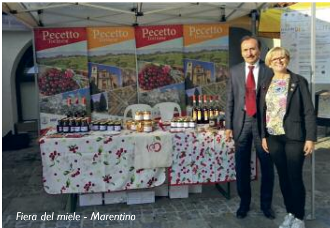
Fiera del miele - Marentino

R ecentemente alcuni pecettesi hanno contestato alla nostra amministrazione, cito testualmente, di non fare nulla " .. per cercare di valorizzare il nostro territorio, le eccellenze agroalimentari pecettesi, le capacità di trasmettere i saperi e tradizioni, l'offerta agrituristica e le attività di accoglienza rurale, le fattorie didattiche. In altre parole, mettere le aziende agricole pecettesi a sistema con quanto già esiste nel territorio così da creare alcuni percorsi (del gusto, naturalistico, culturale) che includano l'agroalimentare locale, i monumenti storici, i percorsi naturalistici e i siti d'interesse culturale." Abbiamo quindi preso atto che molte delle iniziative promosse negli anni non sono state sufficientemente comunicate ai pecettesi. Soprattutto non è stato evidente lo spirito che ha animato la nostra azione amministrativa che nel tempo ha cercato di rafforzare la nostra identità locale, di valorizzare il nostro patrimonio culturale e paesaggistico, di sostenere il tessuto produttivo locale e tutte le attività svolte dalle numerose associazioni di volontariato che animano la vita pecettese, attraverso singoli progetti, legati tra loro da un sottile filo rosso.