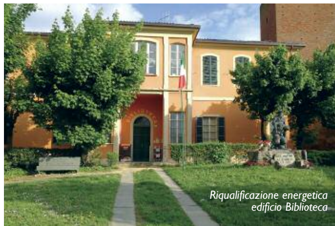
Riqualificazione energetica edificio Biblioteca