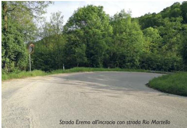
Strada Eremo all'incrocio con strada Rio Martello

Già alla fine del 2015 facemmo con l'allora Vice Sindaco Metropolitano e i suoi tecnici un sopralluogo nel territorio, illustrando i molti problemi esistenti: i tratti sconnessi già allora presenti in strada Revigliasco e strada Virana, la neces-