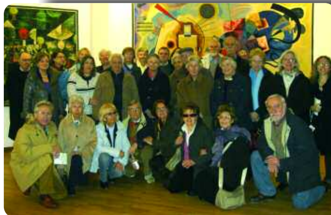
Gruppo dell'Unitre in visita al museo degli arazzi "Scassa" nell'antica Certosa di Valmanera ad Asti il 17 Marzo 2010